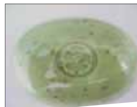
Chondrus grosses paillettes