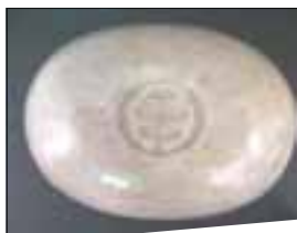
Chondrus petites paillettes