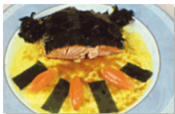
Pavé de saumon en habit vert