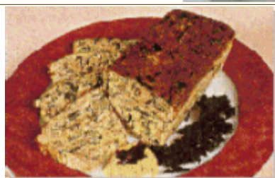
Pain de thon aux algues (Wakamé)