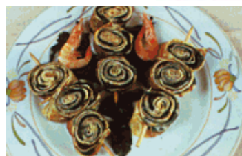
Brochettes de crêpes aux algues

Préparations de Pierrick LE ROUX www.cuisineauxalgues.com